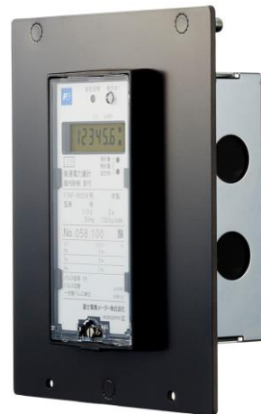
置換パネル取付後